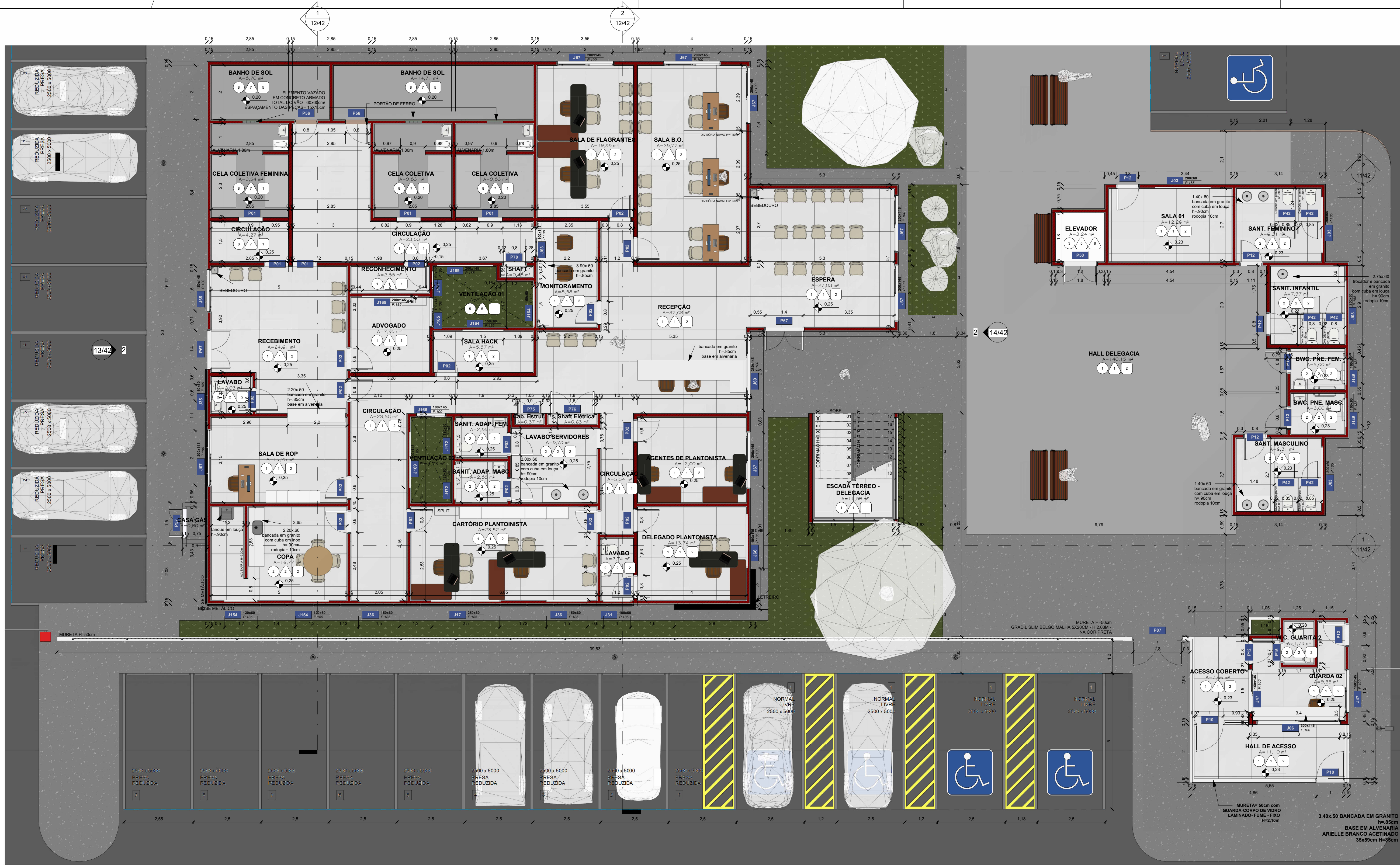
TÉRREO - DELEGACIA ESCALA 1 : 75